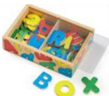
磁性玩具 (如:字母磁鐵)