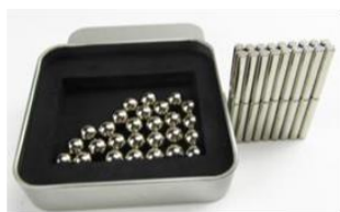
磁性玩具 (如:巴克球益智磁鐵組)